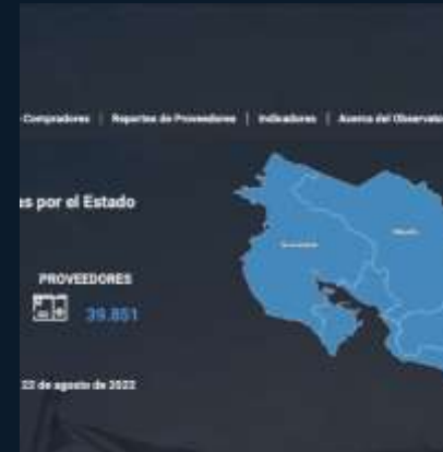
Observatorio de Compras Públicas- Desarrollo de Software