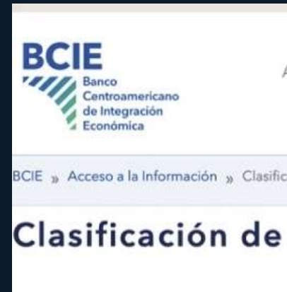
BCIE- Transformación Digital