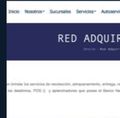
Correos de Costa Rica-BNCR Articulación de Soluciones