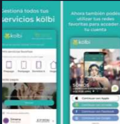
Kölbi-Desarrollo de Software