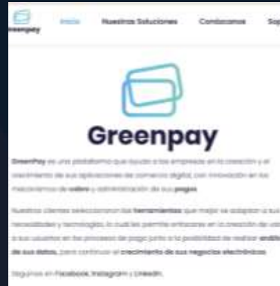
Greenpay Desarrollo de Software